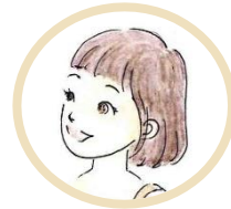
Amico/a (lo studente)